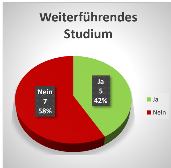
Abbildung 4: Weiterführendes Studium

Knapp die Hälfte aller Grundstudiums-Absolventen hat ein Weiterführendes Studium begonnen: