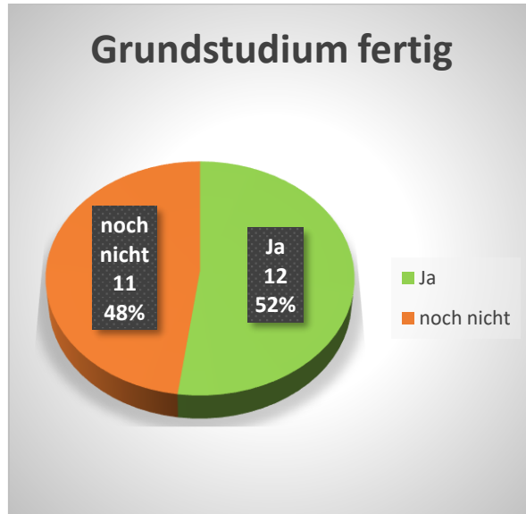
Abbildung 2: Abschluss des Grundstudiums

Alle 23 Teilnehmer haben die HZP bestanden und anschließend ihr Studium begonnen: